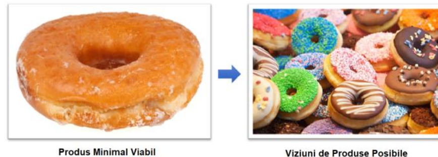
Fig. 2: Exemplu de produs minimal viabil

Informații suplimentare, exemple și sfaturi pentru implementarea dvs. pot fi găsite la: